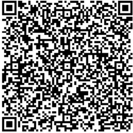
第二届全国大学生生命科学竞赛 决赛现场答辩录像